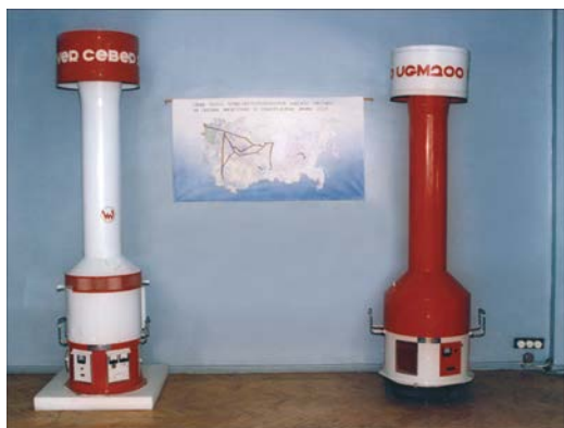
Рис. 2. Автономные источники питания.

В конце 1950-х гг. во Всесоюзном научно-исследовательском институте источников тока под руководством Н.С. Лидоренко получили интенсивное развитие работы в области термоэлектрического метода преобразования энергии, было создано термоэлектрическое отделение, которое в 1968 г. возглавил д.т.н. Н.В. Коломеец, ученик А.Ф. Иоффе. В институте были разработаны высокоэффективные полупроводниковые соединения для низко-, средне- и высокотемпературных областей применения, создавались конструкции термобатарей, в том числе и многокаскадных, проводились их ресурсные испытания, шли работы по созданию термоэлектрических устройств для различных областей применения.