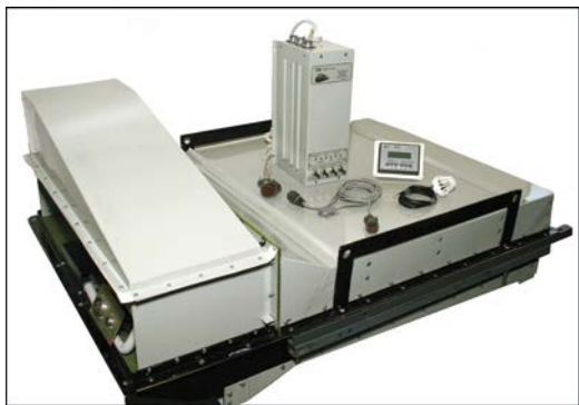
Рис. 4. Термоэлектрический кондиционер для кабины машиниста тепловоза ТЭП70.

торами, использованию более производительных вентиляторов и лучшей компоновке, удалось повысить холодопроизводительность кондиционера.