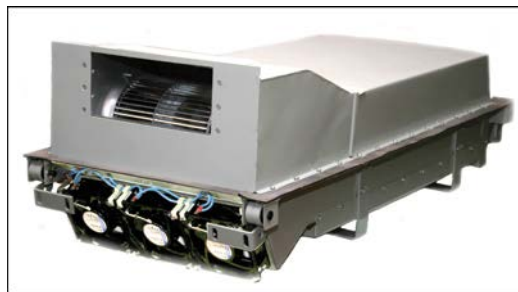
Рис. 3. Термоэлектрический кондиционер для кабины машиниста поезда "Русич" московского метрополитена.

Разработанный на предприятии термоэлектрический кондиционер холодопроизводительностью 1 кВт для кабины машиниста поезда "Яуза" московского метрополитена состоит из двух идентичных охлаждающих блоков по 500 Вт, каждый из которых содержит 48 термоэлектрических модулей, соединённых последовательно-параллельно, контактирующих теплообменными площадками с "холод-