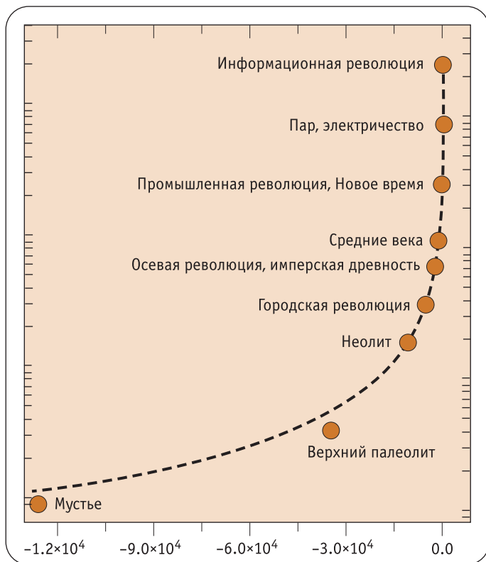
Рис. 1. Экспоненциальная кривая развития технологий и общества по А.Д. Панову.

несколько тысяч лет. На порядок меньший временной отрезок понадобился, чтобы изобрести компьютер, – несколько сот лет. Экстраполируя эту тенденцию в будущее, можно предположить, что для завершения компьютерной революции, комплексной роботизации производства (и выхода из него человека) будет достаточно нескольких десятилетий (максимум столетие).