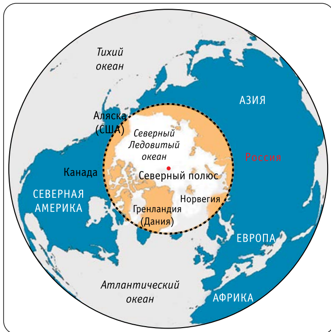
Рис. 1. Территория Арктического региона.

Арктика всё ещё остается мало известной территорией. Хотя познать этот