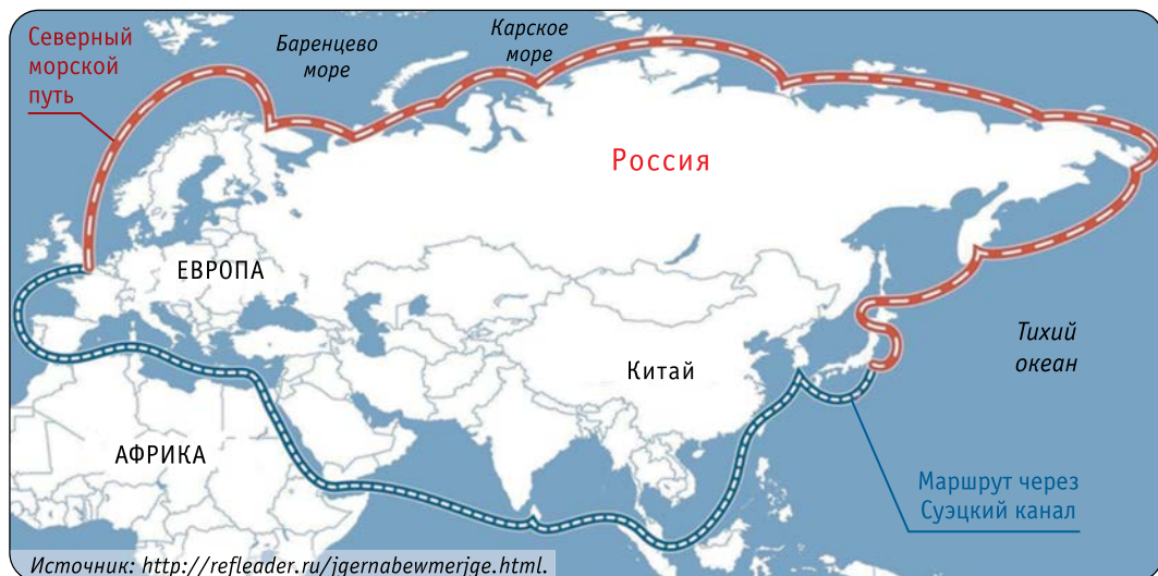
Рис. 2. Маршрут транспортировки грузов с Дальнего Востока в Европу с использованием Северного морского пути (обозначен красным – более 14 тыс. км) и альтернативный путь, использующий Суэцкий канал (обозначен синим – более 23 тыс. км) Источник: https://cont.wsluploads/pic/2016/9/85426.jpg

край и оценить его потенциал стремились на протяжении столетий учёные и мореплаватели многих стран. Значение этой территории для России осознал ещё в середине XVIII века М.В. Ломоносов. Вспомним его слова: “Российское могущество прирастать будет Сибирью и Северным океаном и достигнет до главных поселений европейских в Азии и в Америке” 3 . В наши дни освоение Арктики становится всё более насущной потребностью для человечества, причём не только с “ресурсной” точки зрения, но и как живой системы, которая именно усилиями человека борется за своё выживание и объективно обеспечивает доступность её природных возможностей для использования мировой цивилизацией.